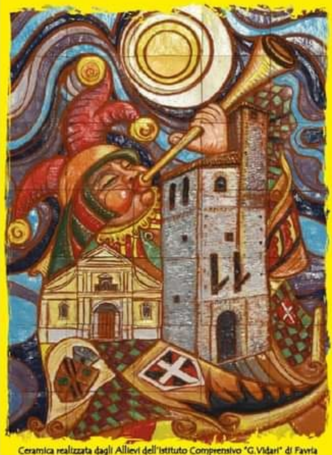
Ceramica realizzata dagli Allievi dell'Istituto Comprensivo "G. Vidari" di Favria

Pro Loco Oglianico - APS OGLIANICO 1-3-4-5-11-12 Maggio 2024